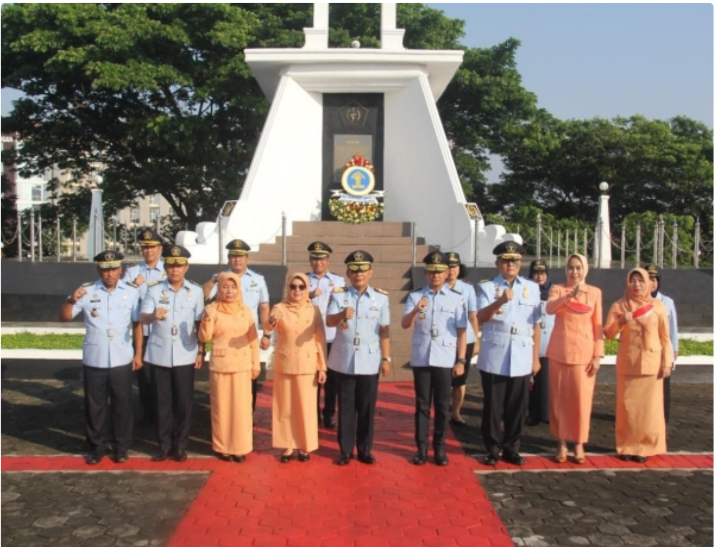
Sambut Hari Dharma Karyadhika Ke-77, Kemenkumham Jateng Gelar Upacara Tabur Bunga di TMP Giri Tunggal

SEMARANG - Bangsa yang besar adalah bangsa yang menghargai jasa para